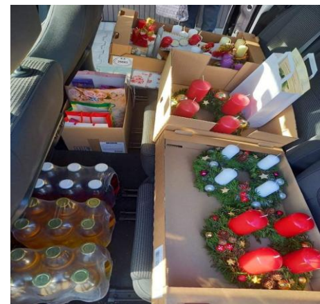
Za dar smo jih iz srca hvaležni.